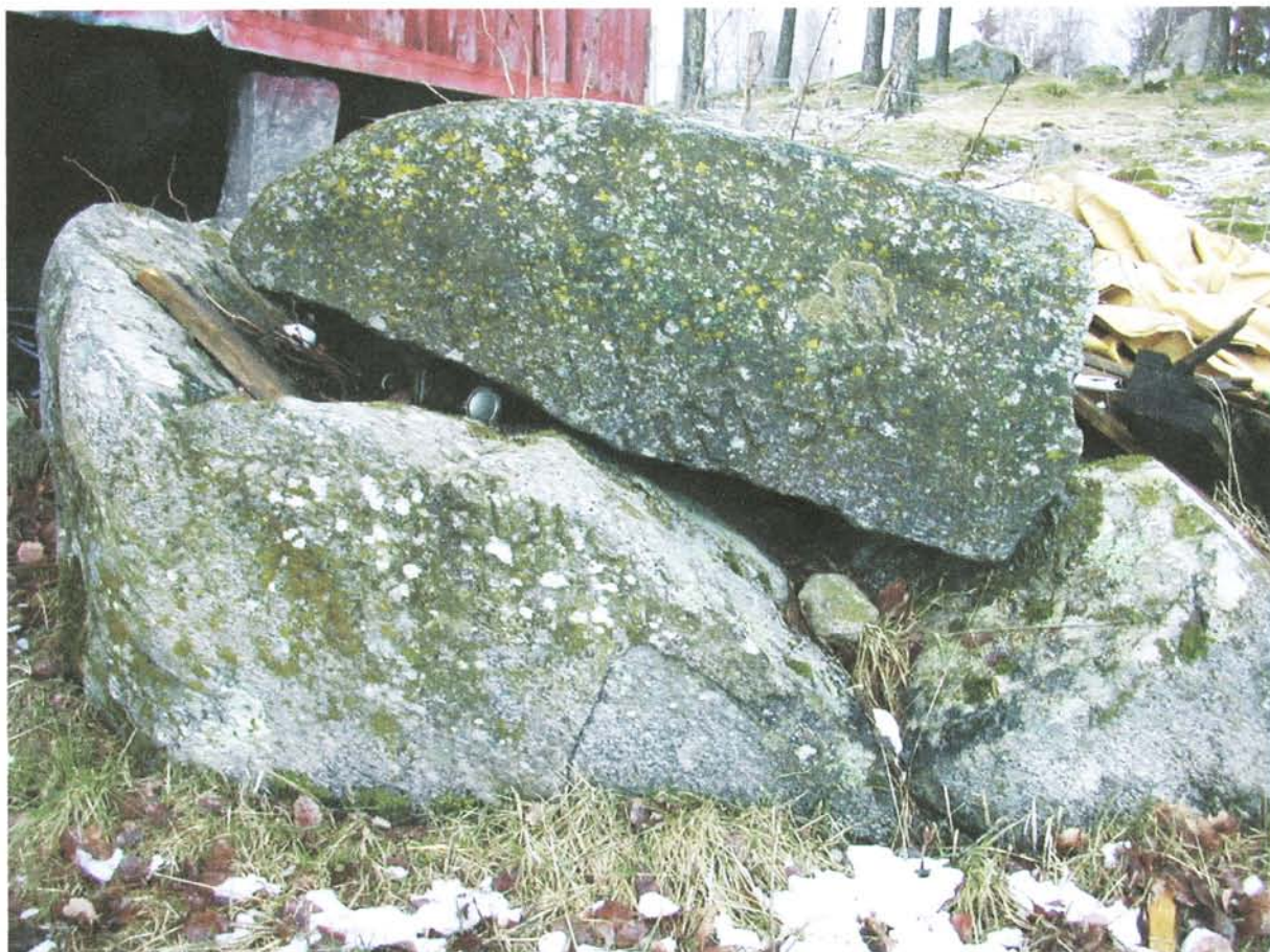
Bild på den återlagda stenen

Från den jordfasta stenen bröts troligtvis två stenar varav den ena återfanns och har placerats åter på den sten den bröts från